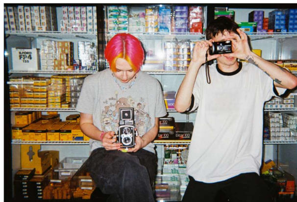
Funcionários do Bellows Film Lab, em Chicago, atendem em loja que revive a fotografia analógica, em 26 de maio de 2023. Internet: < https://exame.com > (com adaptações).

O Globo. Geração Z ativa 'modo nostalgia': entenda o que está por trás dessa tendência . 15 out. 2025. Internet: < https://oglobo.globo.com > (com adaptações).