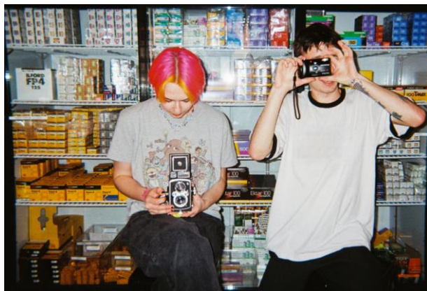
Funcionários do Bellows Film Lab, em Chicago, atendem em loja que revive a fotografia analógica, em 26 de maio de 2023. Internet: < https://exame.com > (com adaptações).

O Globo. Geração Z ativa 'modo nostalgia': entenda o que está por trás dessa tendência . 15 out. 2025. Internet: < https://oglobo.globo.com > (com adaptações).